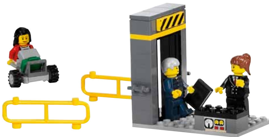
Предполагаемая реализация модели