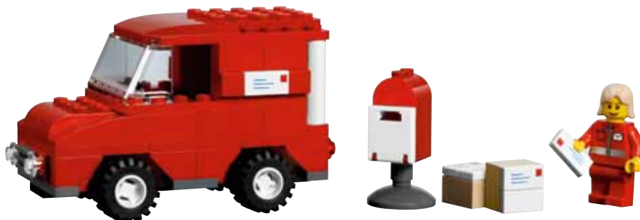
Предполагаемая реализация модели