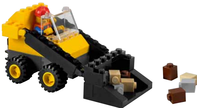
Предполагаемая реализация модели