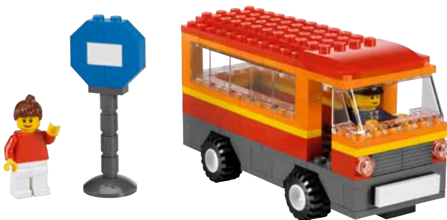
Предполагаемая реализация модели